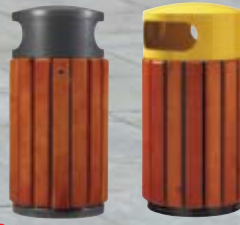
Gris manganeso RAL 1021